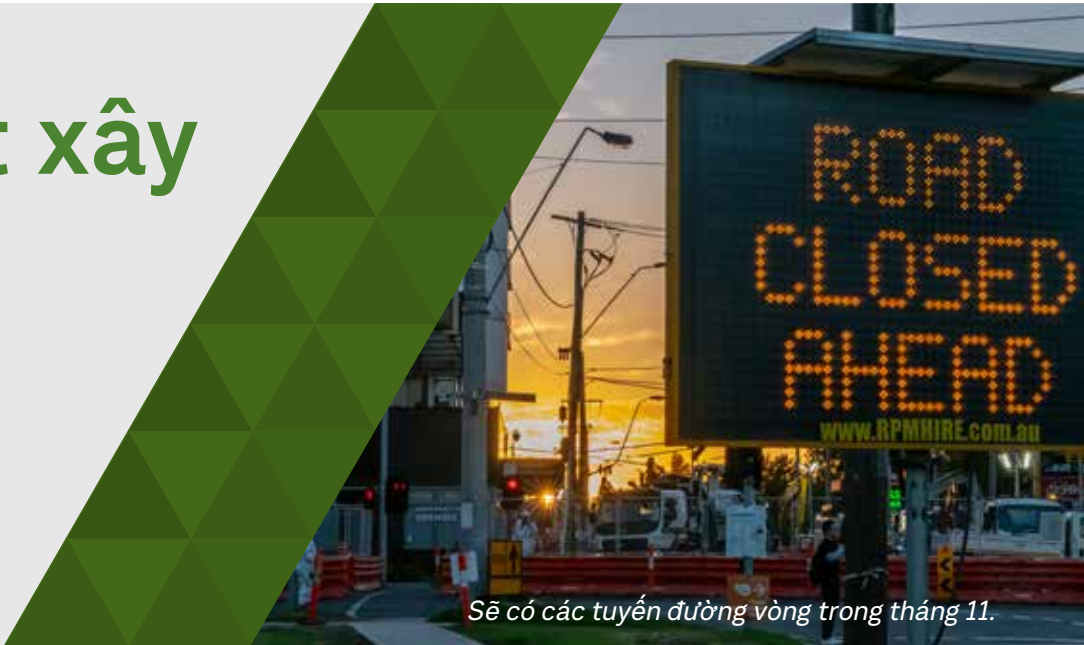
Sẽ có các tuyến đường vòng trong tháng 11.