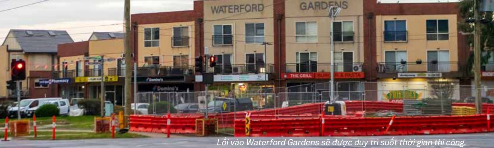
Lối vào Waterford Gardens sẽ được duy trì suốt thời gian thi công.